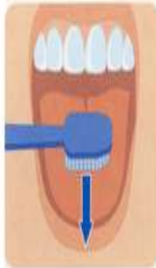
6. Чистка языка