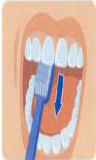
3. Внутренние поверхности передних зубов