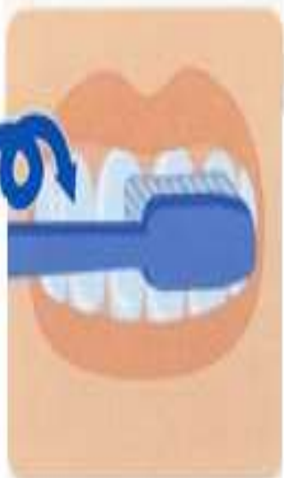
5. Массаж десен