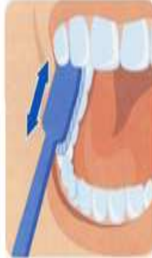
4. Жевательная поверхность зубов