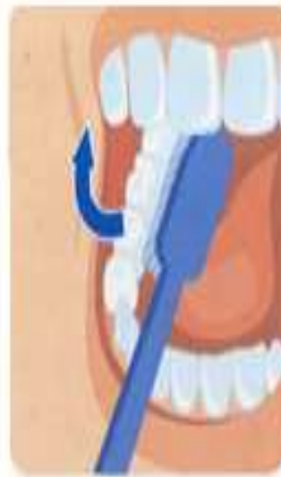
2. Внутренние поверхности зубов