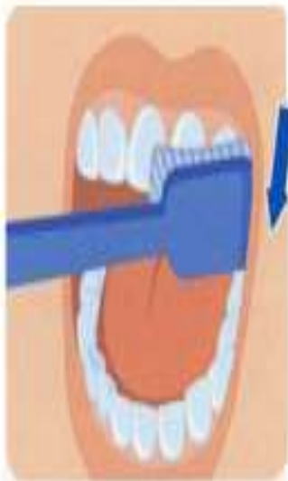
1. Наружные поверхности зубов